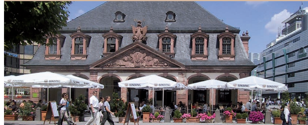
Cafe Hauptwache, Frankfurt am Main

Die Balance zwischen Funktion und natürlicher Ästhetik ist das erklärte Ziel jeder Behandlung. Die Umsetzung neuester Erkenntnisse im Bereich der Prophylaxe, Dental-Kosmetik und Dental-Wellness sind eine Selbstverständlichkeit.